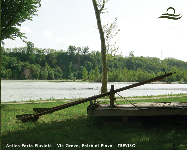
Antico Porto Fluviale - Via Grave, Falzè di Piave - TREVISO