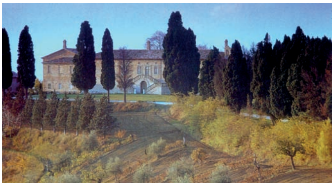
La Villa del Bali in una foto del 1992