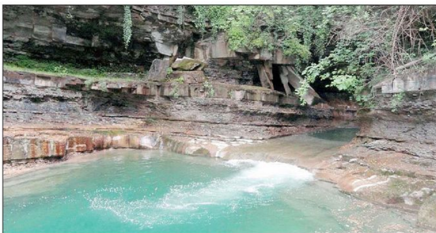
Le acque del Rabbi nella zona di Premilcuore